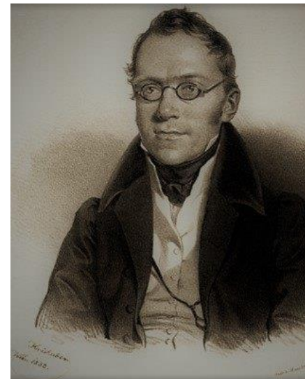
Lithografie von Joseph Kriehuber, 1833

Musikalisch dokumentiert das Werk einen Entwicklungsschritt innerhalb seiner Gattung. Es besteht nicht mehr aus einfach begleitender Virtuosität, sondern, entfaltet sich auf dem Hintergrund sinfonischer Kompositionsprinzipien. Der dramatische erste Satz folgt einem von Mozart entwickelten Typus mit militärischen Anklängen. Das Klavier setzt erst ein, nachdem das Orchester ein zweites Thema angespielt hat, beteiligt sich also vor allem an Durchführung und Reprise des Sonatensatzes. Der gefühlsbetonte zweite Satz stellt dagegen ganz das Klavier in den Vordergrund, die Streicher begleiten mit wenigen dezenten Akkorden und treten nur in den Pausen der Solostimme hervor. Auch im abschließenden Rondo beginnt das Klavier, diesmal mit einem energischen Thema in c-Moll. In der Mitte des symmetrisch angelegten Satzes erklingt ein fugierter Teil und das Satzende besteht aus einer zum Presto beschleunigten Coda in C-Dur.